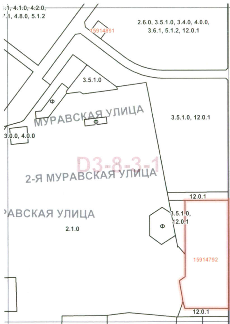
Схема границ подготовки проекта внесения изменений в правила землепользования и застройки города Москвы в отношении территории по адресу: участок №12 в соответствии с «Проектом планировки территории, расположенной вблизи территории Рождествено района Митино г. Москвы» (кад. № 77:08:0000000:3309), СЗАО

Приложение к распоряжению Москомархитектуры от 12.09.2017 г. № 191